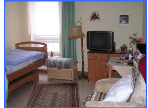
- Einzelzimmer -

Kapazität/Struktur: 28 Altenpflegeplätze