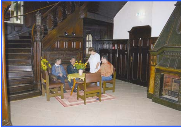
- Diele -