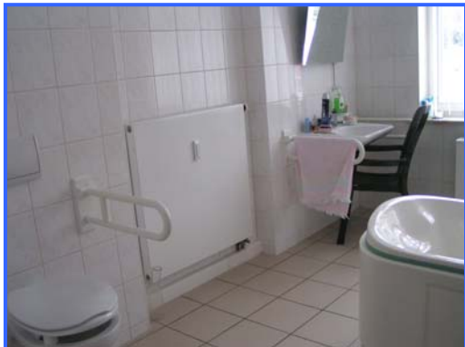
- Pflegebad -

Pflegestufe III – Schwerstpflegebedürftige bis zu 1.432,-- € Sachleistung monatlich