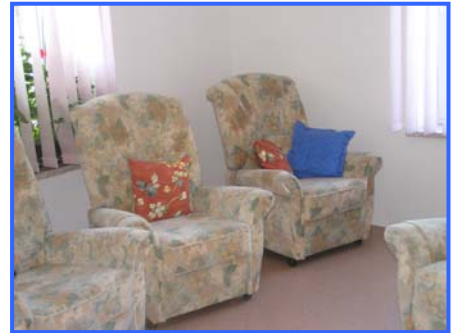
- Ruheraum -

Pflegestufe I – erhebliche Pflegebedürftigkeit bis zu 384,-- € Sachleistung monatlich