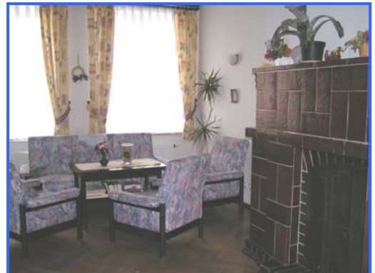
- Kaminzimmer -