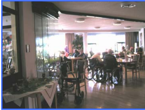
- Aufenthaltsbereich -