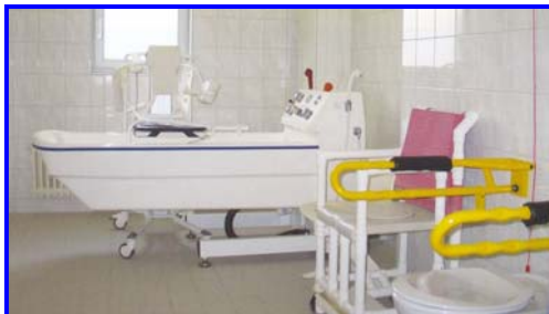
- Pflegebad -

Die Zimmer verfügen über Pflegebett, Betttisch, Kleiderschrank, Anrichte, Tisch und Stühle. Des weiteren sind Telefon- und Fernsehanschluss, Schwesternruf und Außenjalousien vorhanden. Die Nasszellen sind mit Dusche, WC und Waschbecken ausgestattet.