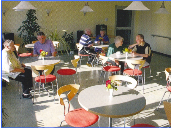
- Cafeteria -