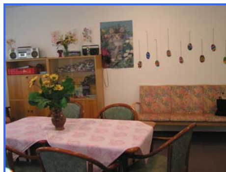
- Bastelraum -