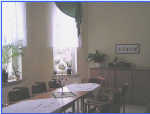
- Aufenthaltsbereich -