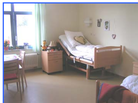
- Doppelzimmer -