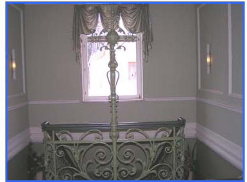
- Treppenhaus -