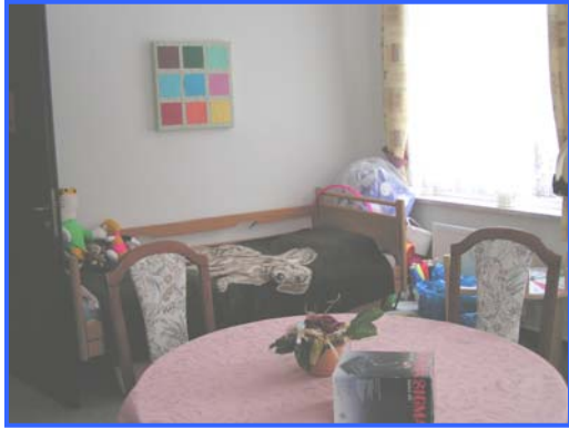
- Therapieraum -