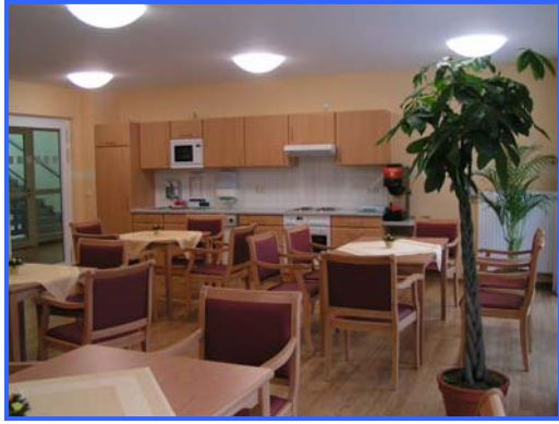
- Wohn-/ Küchenbereich -