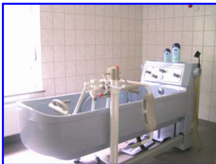
- Pflegebad -