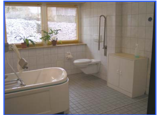
- Pflegebad -