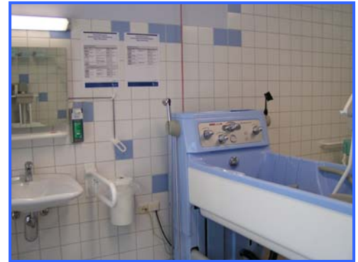
- Pflegebad -