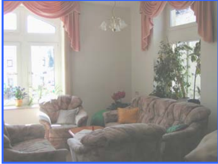
- Aufenthaltsraum -