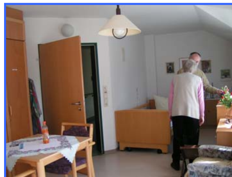
- Einzelzimmer -