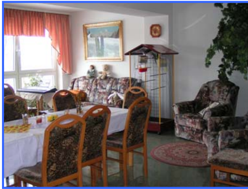
- Wohnbereich -