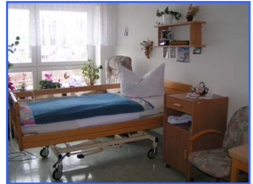
- Einzelzimmer -

Kapazität/Struktur: 29 Altenpflegeplätze