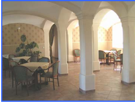
- Festsaal -