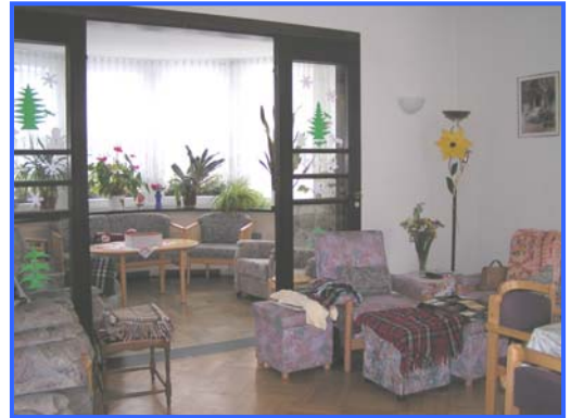
- Wohnbereich -

Kapazität/Struktur: 20 Tagespflegeplätze